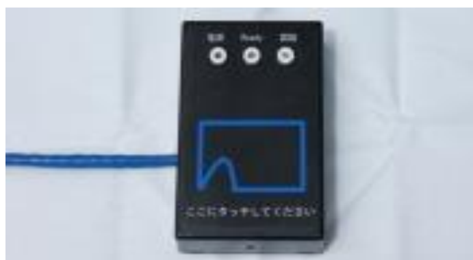
FeliCa対応 非接触ICカードリーダー